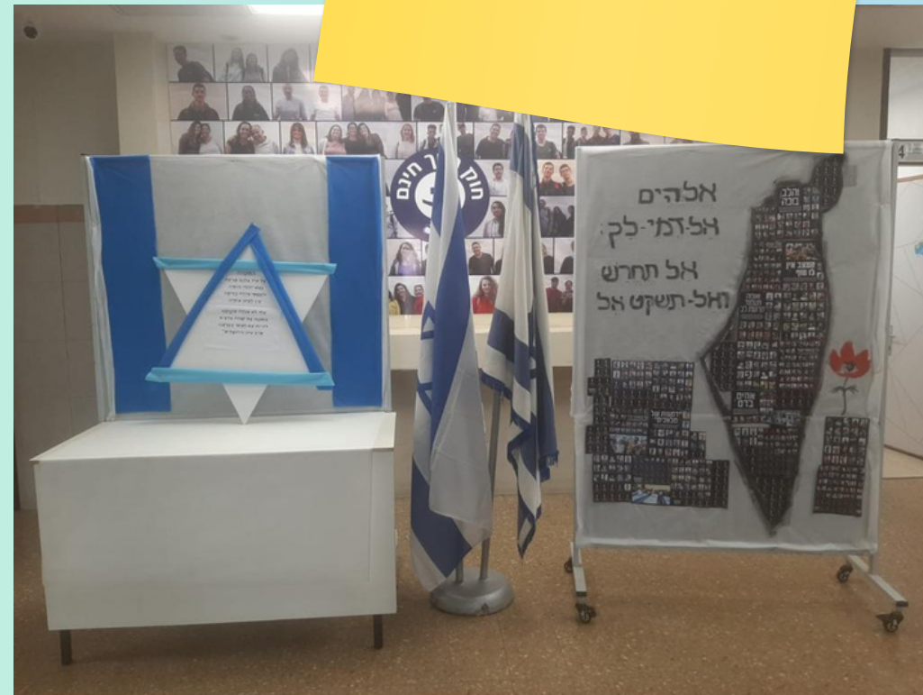
אורט גוטמן, נתניה