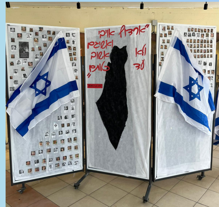
אורט שרת, נוף הגליל