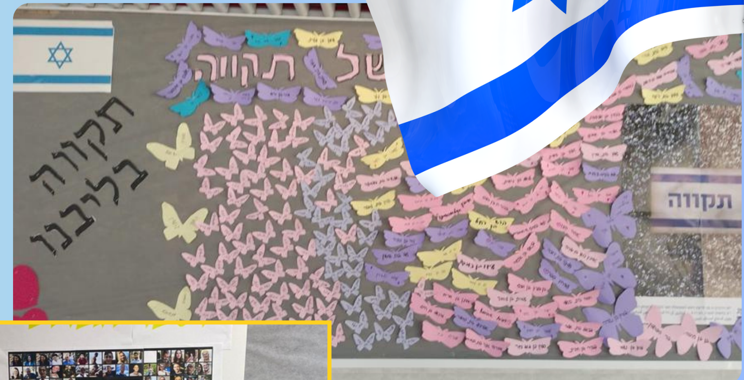
אורט אורן, עפולה