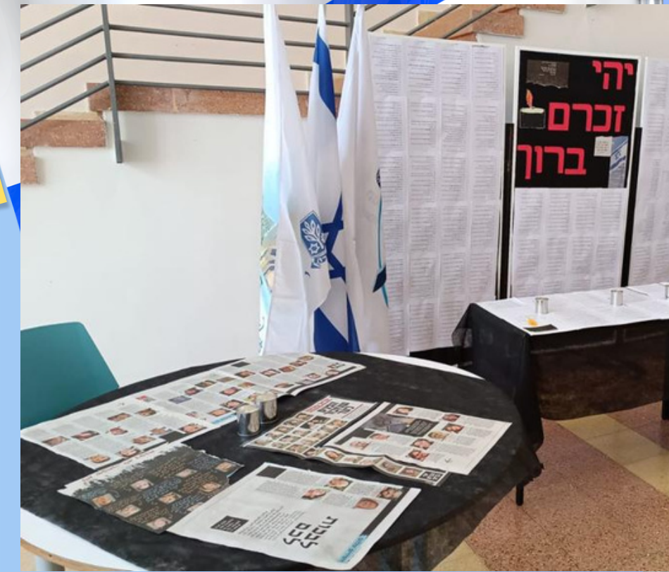
אורט קרית האומנים, רמלה

שילוב אביזרים רלוונטיים: מפה טקסט תמונות