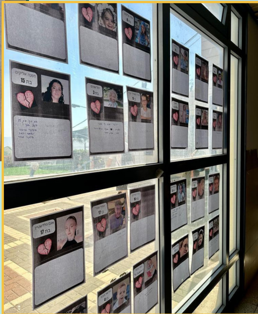
אורט במעלה, טבריה