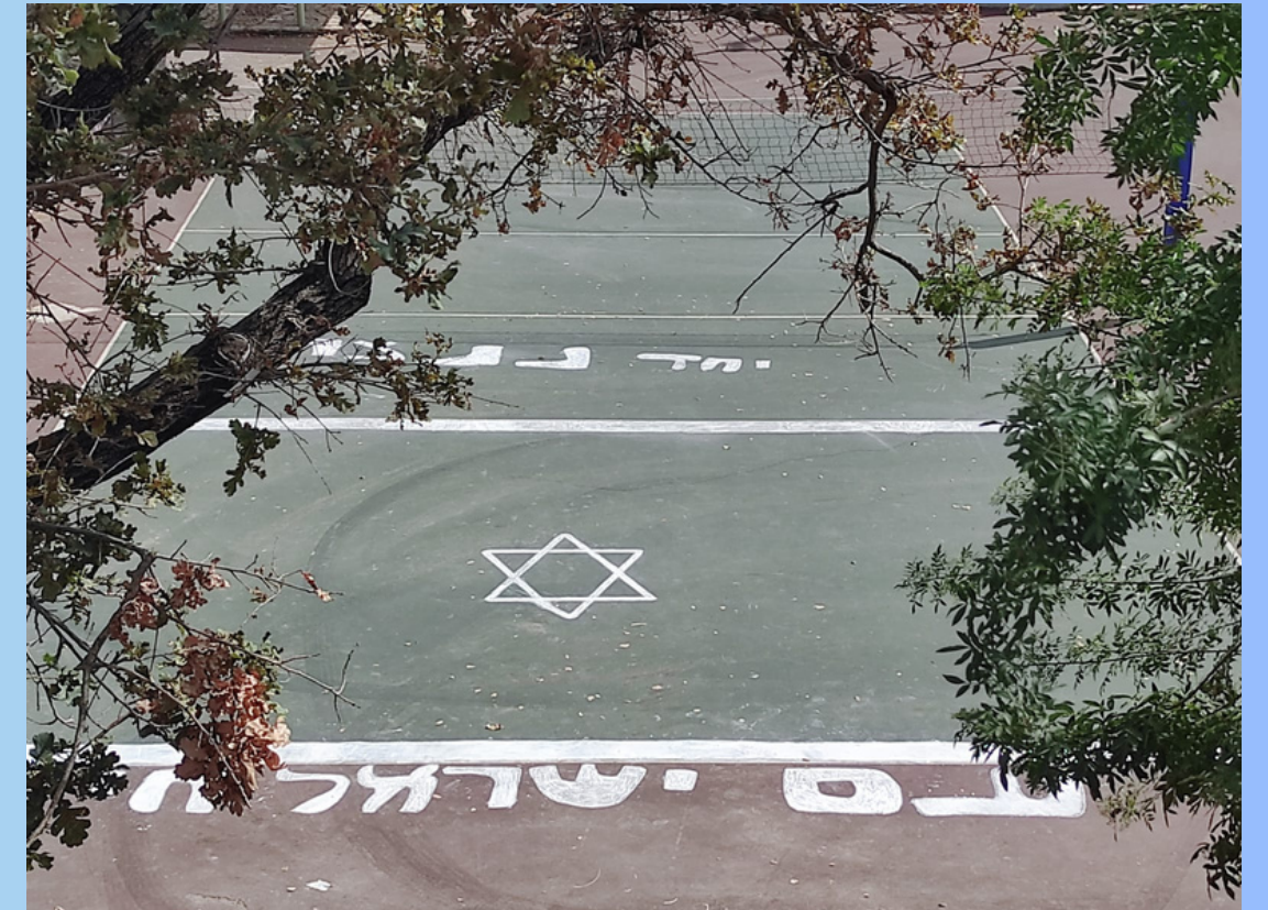
אורט גרינברג, קרית טבעון