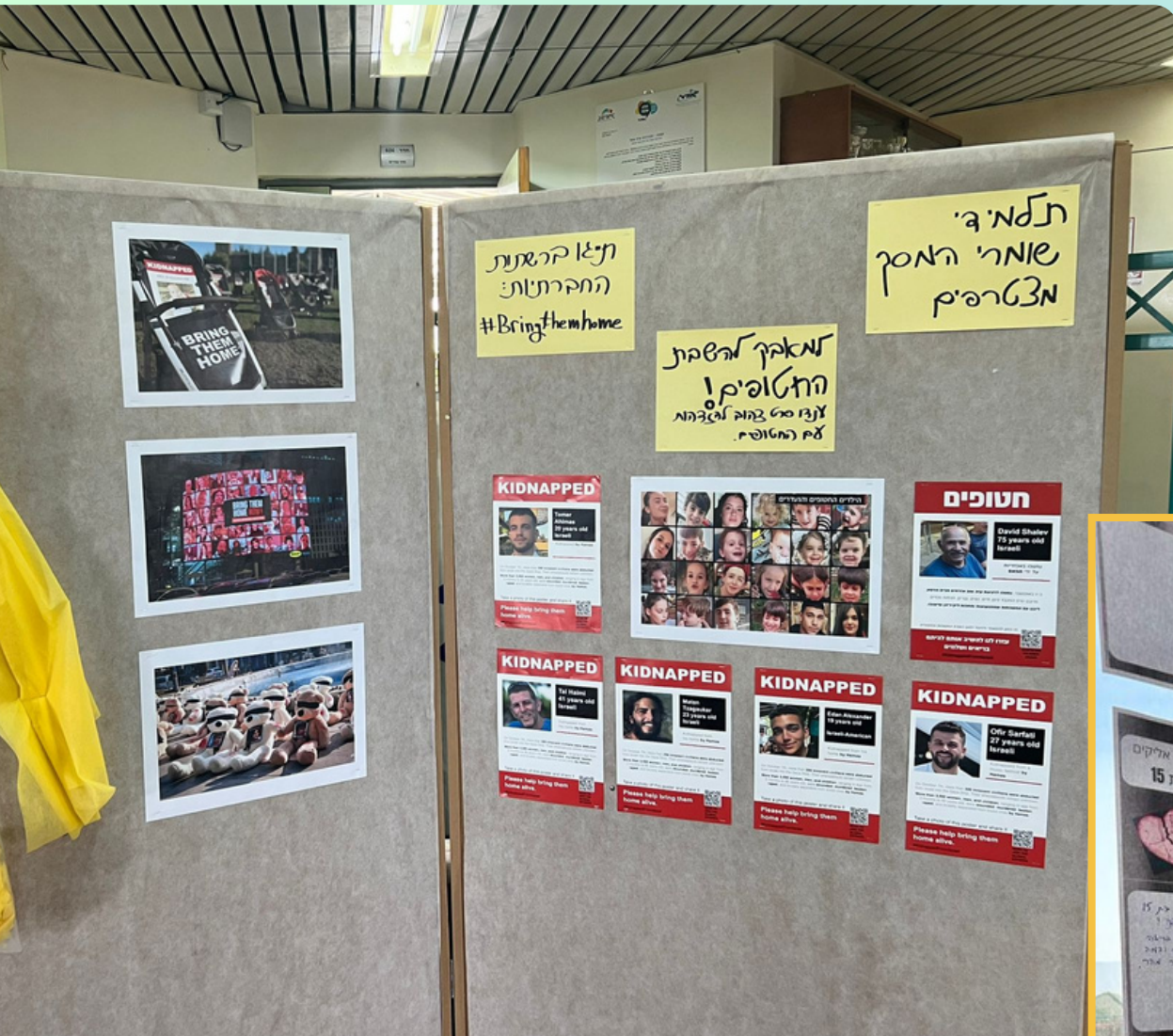
אורט פסגות, ברמיאל