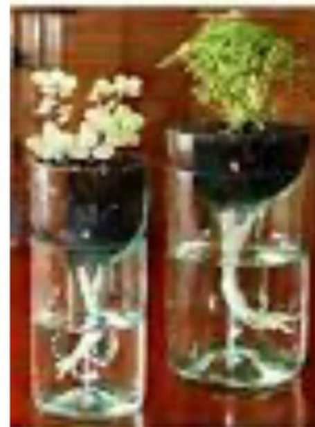
Glass Wine Bottle