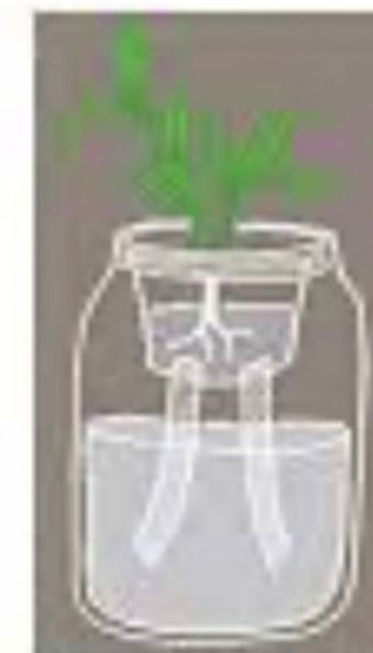
Mason Jar Net Pots