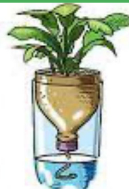
Plastic Beverage Bottle